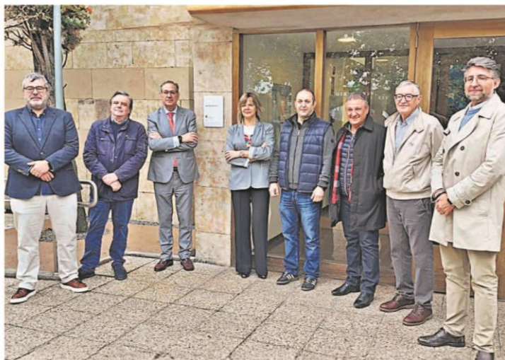
Acto de reconocimiento al edificio del Colegio Hernán Cortes con representantes del Colegio Oficial de Arquitectos de León (delegación de Salamanca), del Ayuntamiento de Salamanca, de la Junta de Castilla y León, Colegio de Arquitectos Técnicos de Salamanca y de Resa, empresa que gestiona el edificio.

"Hemos tenido una gran oportunidad con los Fondos Next Generation pero las administraciones, en este caso la Junta de Castilla y León, deberían haber sido más ágiles en su tramitación y en su divulgación. Ahora que se acaban los plazos para estas subvenciones perdiéndose mucho dinero, debería informarse a la