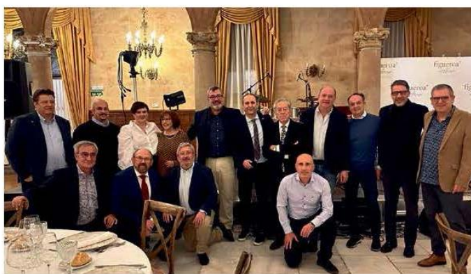
Colegiados homenajeados por el Colegio de Arquitectos, en la celebración de su patrona

En definitiva, “representar y defender la profesión ante las